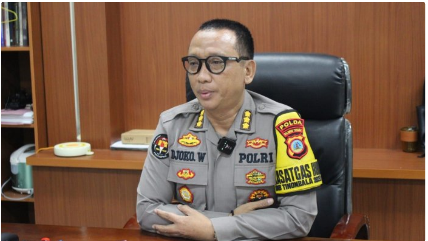
Kabidhumas Polda Sulteng Kombes Pol. Djoko Wienartono

PALU, Sulawesi Tengah- Kepolisian Negara Republik Indonesia (Polri) dalam tahun anggaran (T.A) 2024 kembali membuka pendaftaran penerimaan calon Taruna Taruni Akademi Kepolisian (Akpol) untuk putra-putri terbaik lulusan SMA/MA/Sederajat.