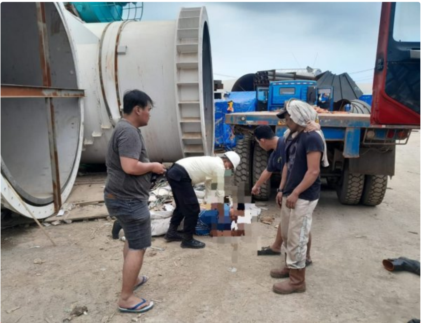
Pelaku Narkotika diringkus aparat Polres Morowali

MOROWALI, Sulawesi Tengah- Personel Satresnarkoba Polres Morowali meringkus pelaku narkotika seorang laki-laki berinisial MAMR alias A (26 tahun) dengan barang bukti Narkotika jenis sabu, Selasa, (23 Juli 2024).