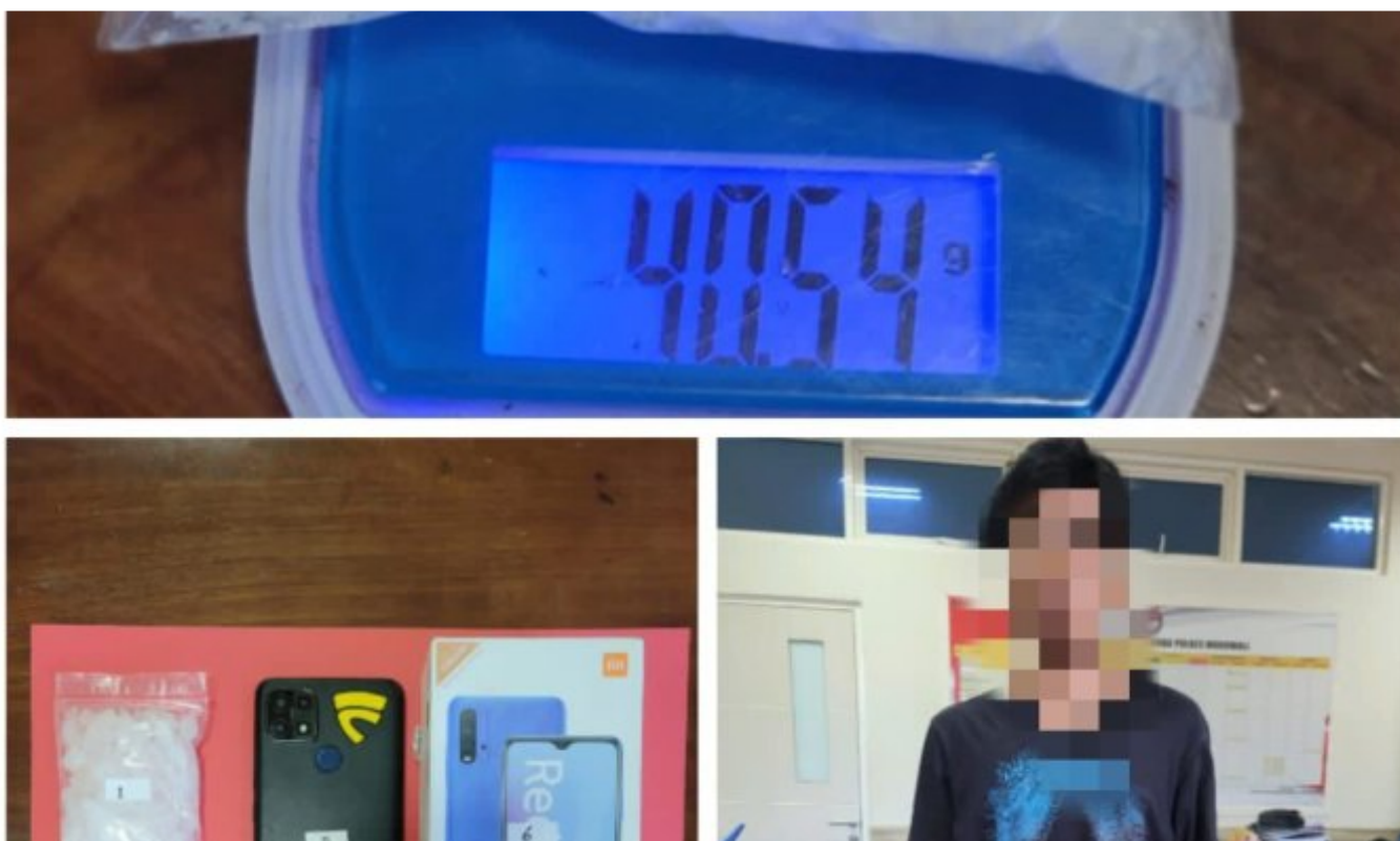
Tsk beserta Babuk di amankan Satresnarkoba Polres Morowali

MOROWALI, Sulawesi Tengah- Polres Morowali berhasil mengungkap serangkaian tindak pidana narkotika yang berhasil dilakukan oleh Satuan Reserse Narkoba (Satresnarkoba) Res Morowali, Pada sejumlah kejadian yang terjadi pada tanggal 26, 27, dan 28 Juli 2023, petugas berhasil menangkap tiga tersangka berbeda dengan berbagai barang bukti yang terkait dengan narkotika jenis sabu.